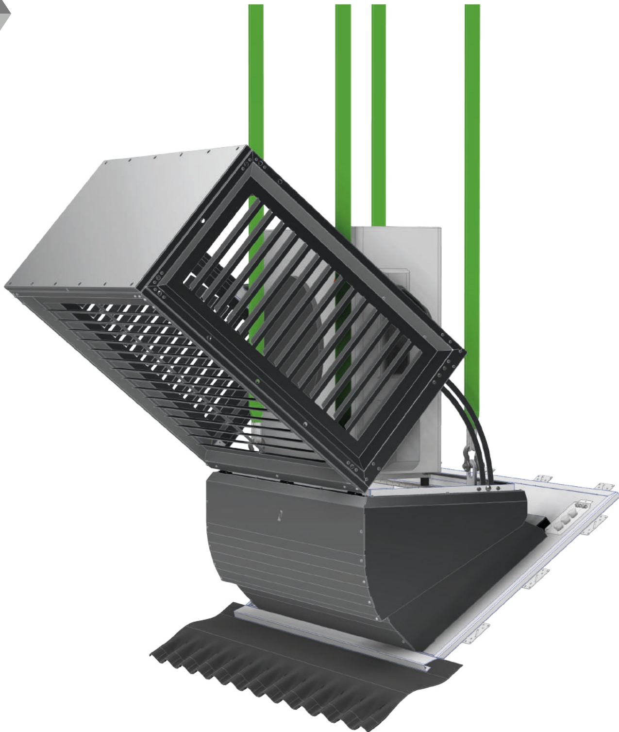
Figuur 1: Hjsen Makera

Breman Installatiefabriek - versie juli 2024